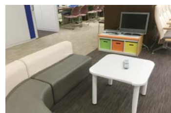
2階 キッズコーナー

また、2階待合室にはキッズコーナーがあり、お子様向DVDをご用意しておりますので、お気軽にスタッフまでお申し付けください。