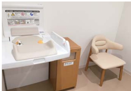
1階 授乳室 おむつ交換台