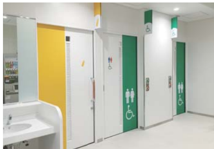
1階 多目的トイレ・授乳室入口