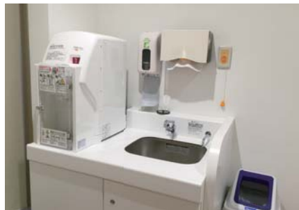
1階 授乳室 ミルク用給湯器